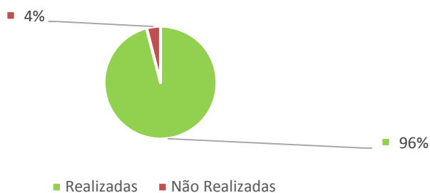
Atividades realizadas vs não realizadas

Das 50 atividades previstas no PAA inicial para o 1.º Período, foram realizadas e avaliadas 48. Não se realizaram 2 atividades. A atividade n.º PAA-009 - Caminhada "Todos juntos fazemos mais" devido ao estado do tempo e a atividade PAA-042 "visita a uma queijaria" por incompatibilidade de agenda. De referir que estas duas atividades irão ser realizadas em datas a acertar.